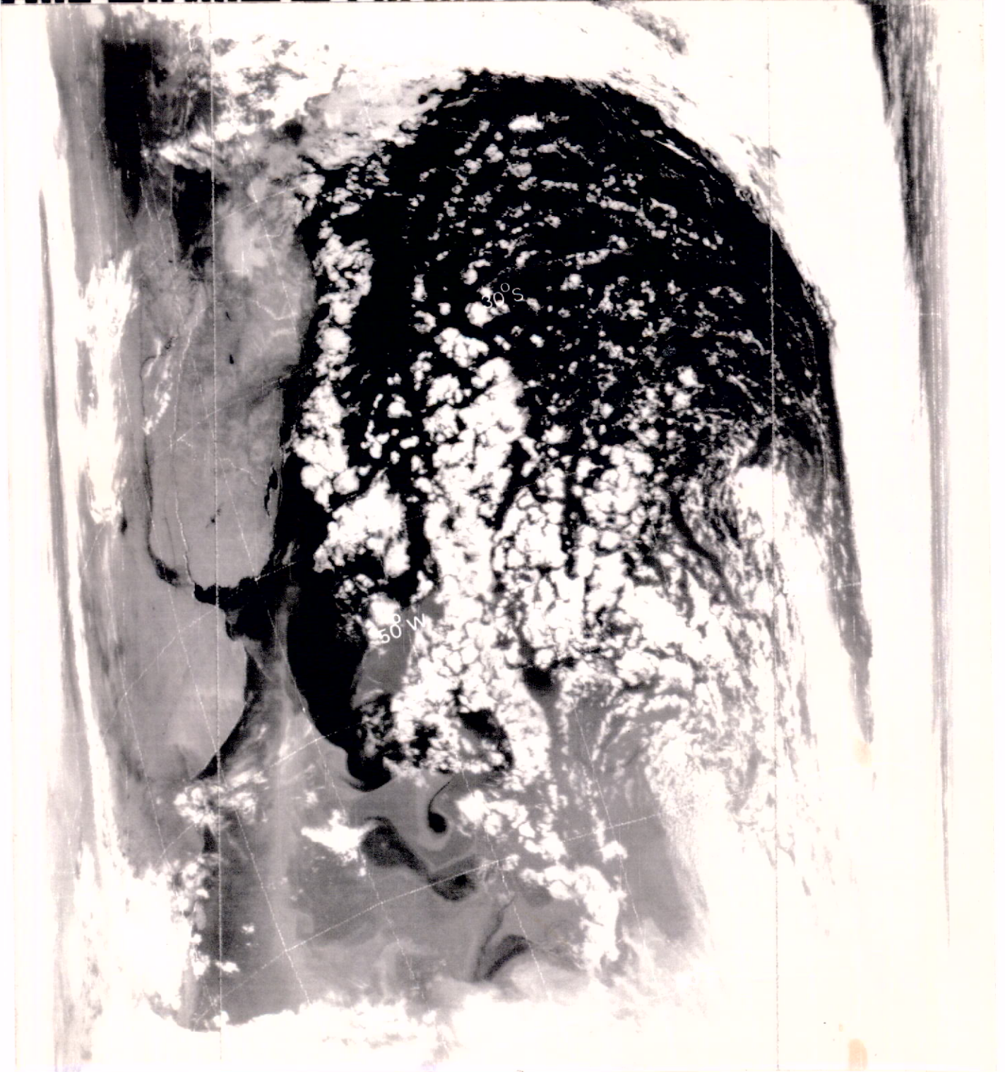
Realçando Variações de Temperatura Normal