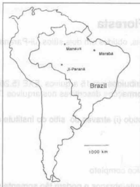
Figura 1 - Sítios do Projeto ABRACOS.