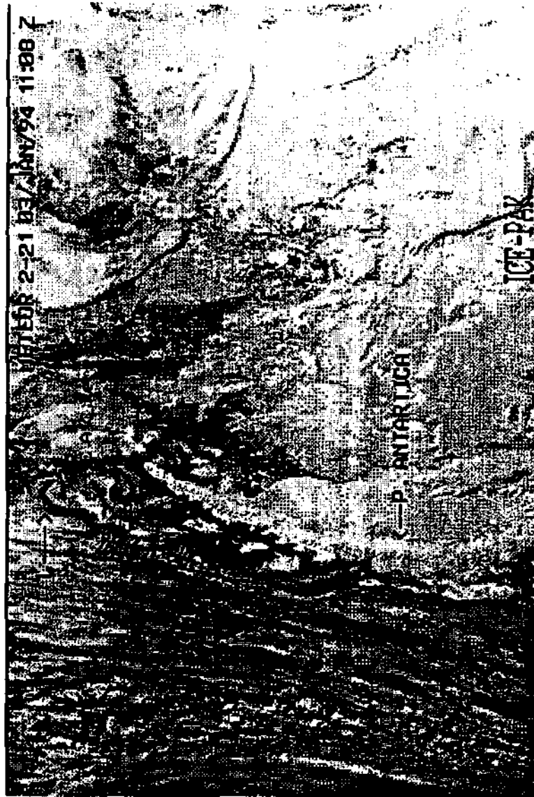
Figura 2 - Imagem do satélite METEOR 2-21 recebida na EACF no dia 3 de janeiro de 1994.